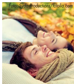
*Vitamin C trägt zu einer normalen Funktion des Immunsystems bei.

fahren aus den Zellwänden von Hefe gewonnen und kann in dieser Form kaum über die Nahrung aufgenommen werden. RYDEX 375 Immun-Power* ist exklusiv in Ihrer Apotheke erhältlich. Mehr Informationen zum Produkt und den natürlichen Inhaltsstoffen finden Sie unter www.rydex-immunpower.de .